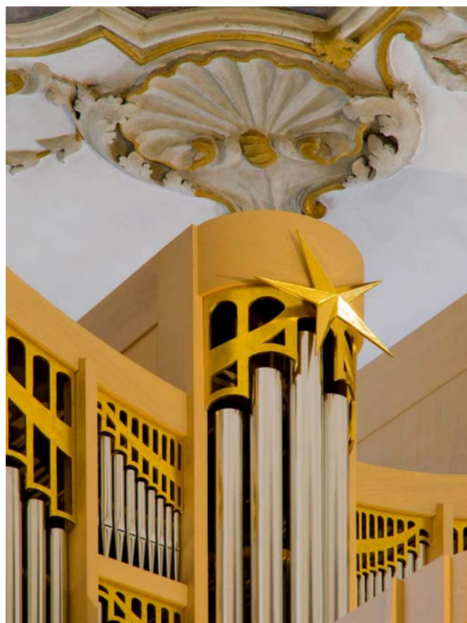
La stella dello "Zimbelstern"