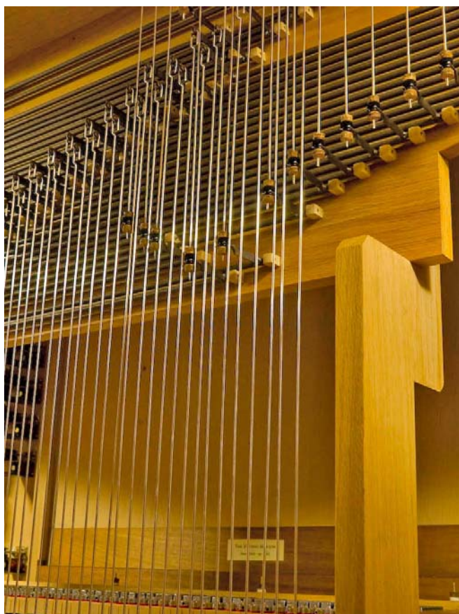
La catenacciatura del Grande Organo